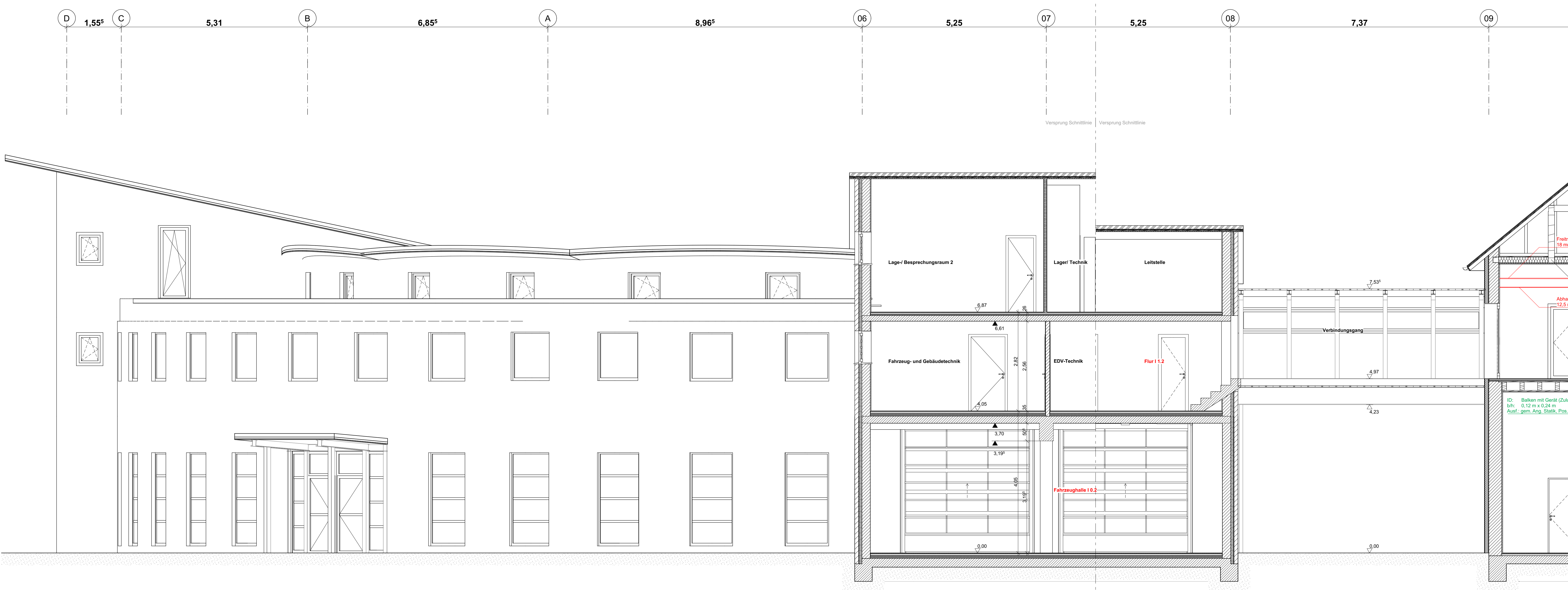
02 Längsschnitt Rettungsdienst 1:50